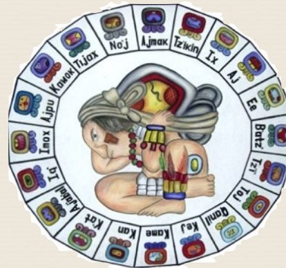
Tzolkin (Maya Kalender) mit dem „Träger der Zeit“

Um dem Interesse der Teilnehmer_innen zu entsprechen, ist viel Raum für Kommunikation vorgesehen.